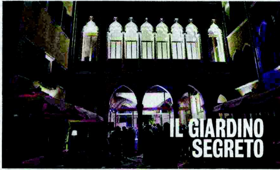
IL GIARDINO SEGRETO