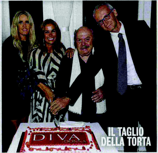
IL TAGLIO DELLA TORTA