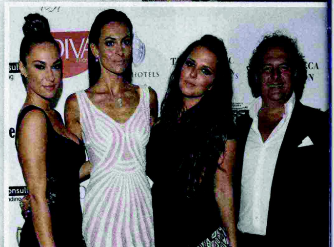
LO CHEF SIMIONATO CON LA MOGLIE